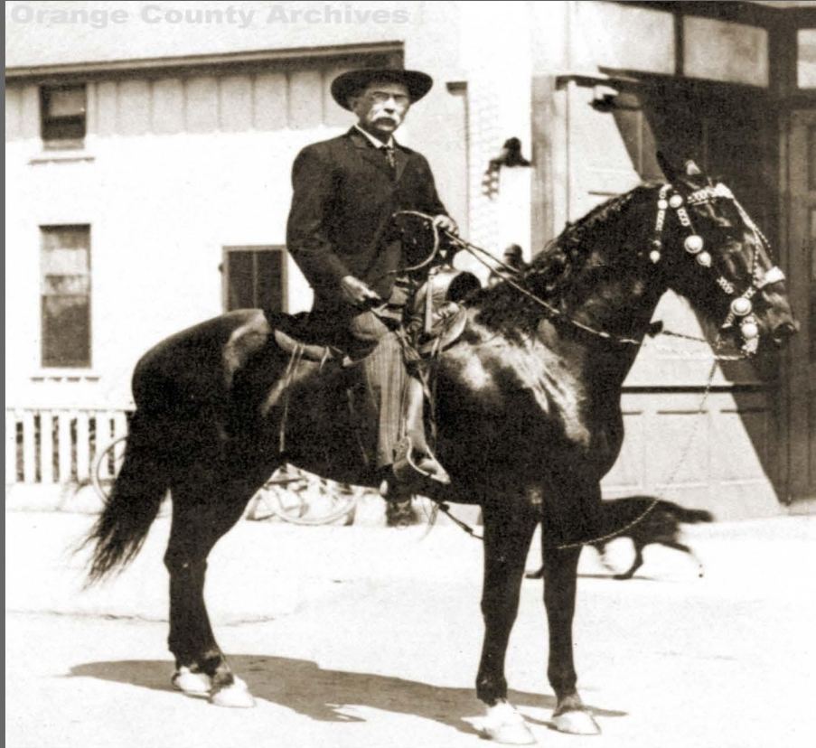
말을 타고 있는 레이시 보안관.