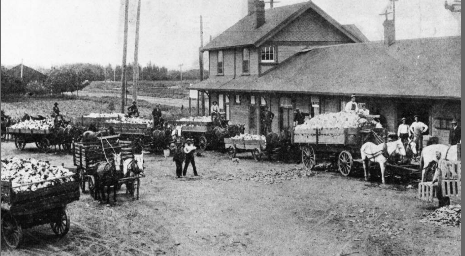
La estación del Ferrocarril del Pacífico Sur en Anaheim, después de 1895. Aunque el "Esspee" comenzó a prestar servicio en Anaheim en 1875, los ferrocarriles no transformaron la economía del condado de Orange hasta que el Ferrocarril de Santa Fe también llegó a finales de la década de 1880. La competencia hizo bajar los precios, lo que permitió distribuir los productos locales por todo el país a un costo económico.