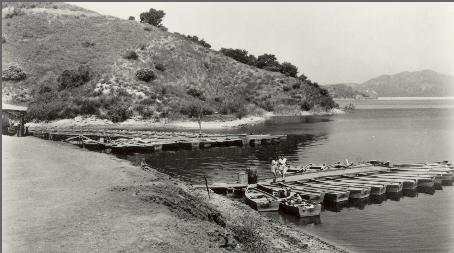
Lago Irvine en la década de 1940.