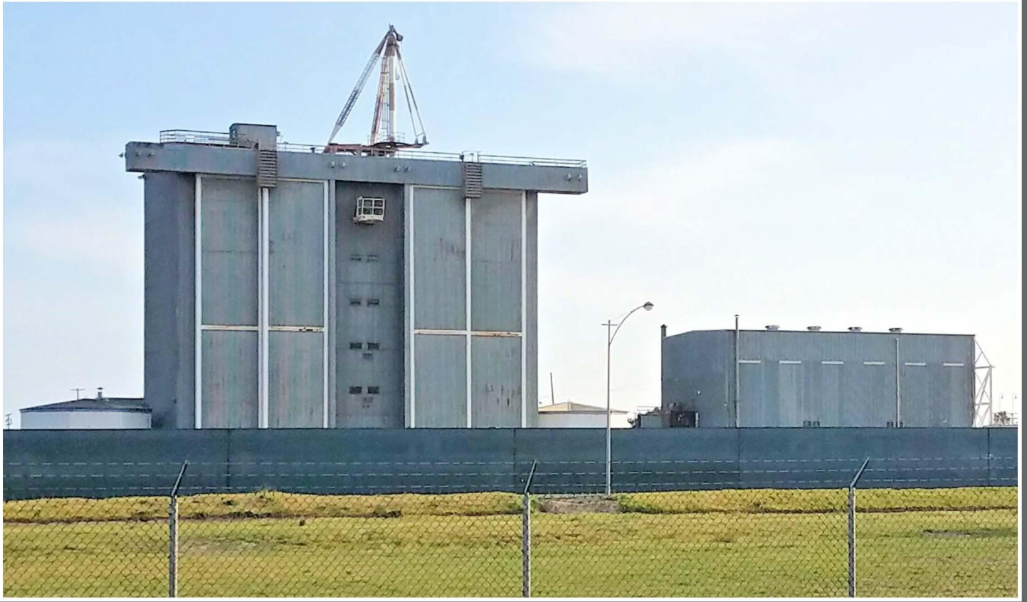
새턴 로켓 조립 건물, 썬 비치, 2018 년.