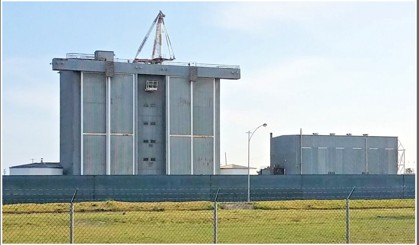
土星火箭組裝大樓，海豹灘市（Seal Beach），2018年。